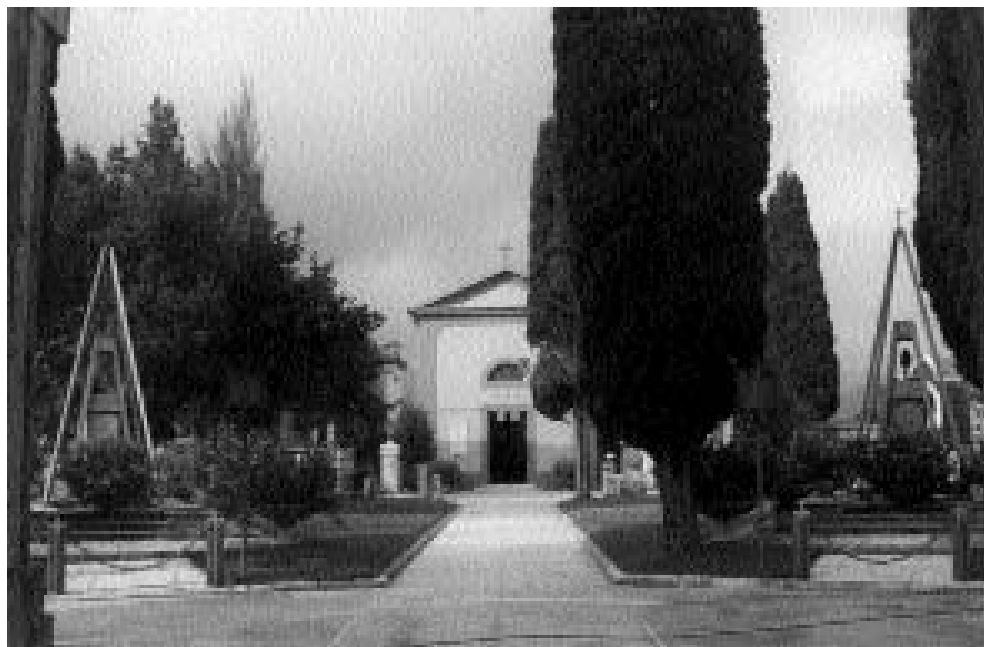
Il cimitero di Cassino