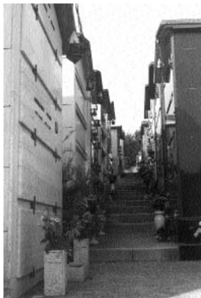
Il cimitero di S. Angelo in Theodice