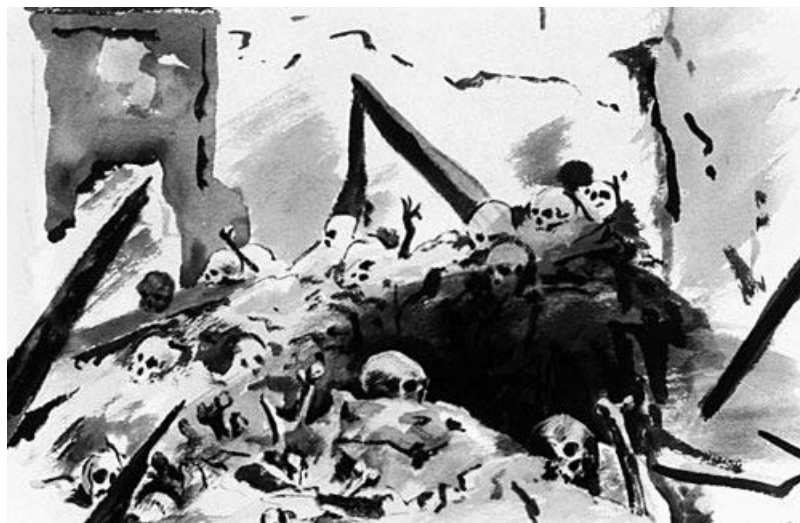
“Bone pile at Cassino”, di Tom Craig