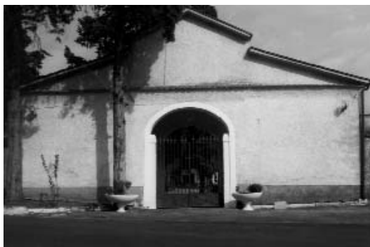
Il cimitero di Caira