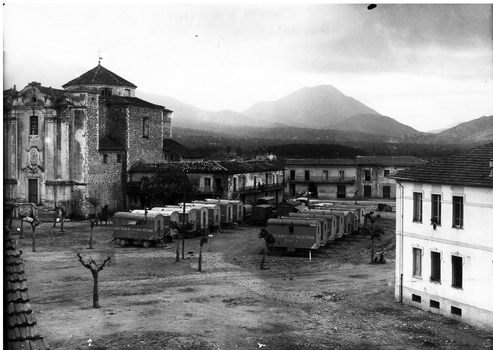
Chiesa del Carmine.