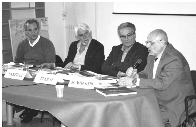
San Pietro Infine 4 marzo 2017.