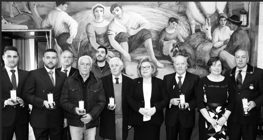
Gli insigniti della "Medaglia d'Onore"