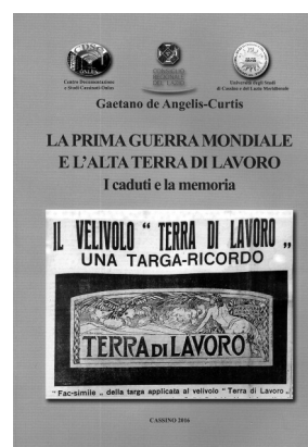
Copertina del volume premiato La prima guerra mondiale e l'alta Terra di Lavoro (sopra) e il premio (in basso)