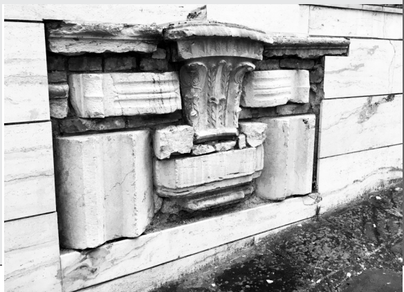
Cervaro, via Cervo..

In merito all'articolo pubblicato sul numero scorso di Studi Cassinati, n. 4-2017 alle pp. 306-312, Cassino, i francescani e S. Antonio , il socio Giandomenico Fagnoli ci informa che la decisione dell'arch. Giuseppe Poggi di inserire, su un lato della canonica della chiesa di S. Francesco a Cassino, vari «interessantissimi frammenti di capitelli e di altri elementi decorativi e architettonici» rinvenuti «tra le macerie della chiesa e del campanile», fu presa anche su sollecitazione di Giuseppe Cataldi, presidente della Corte dei Conti, all'epoca incaricato dal governo provvisorio alleato di occuparsi dello stato del patrimonio artistico di Cervaro e Cassino dopo le distruzioni belliche e dei provvedimenti urgenti di salvaguardia da adottare. Non deve essere un caso se in una parete di un'abitazione di via Cervo a Cervaro ubicata di fronte alla Chiesa Maggiore e sita a qualche decina di metri dal palazzo Cataldi, si sia giunti, in fase di ricostruzione postbellica, a esiti simili.