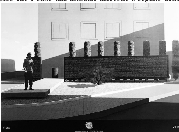
«Giacomo Bianchi & Partners Architects»: vista e vista prospettica.