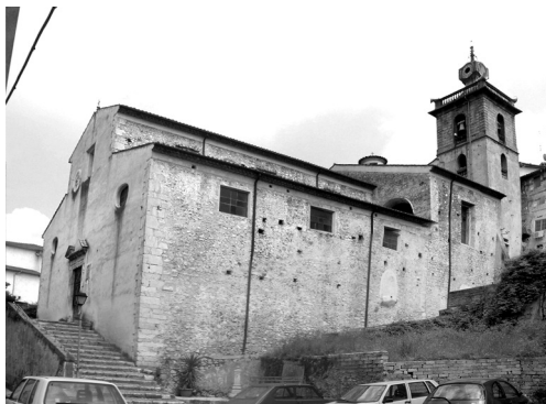
a chiesa di S. Maria La Nova.