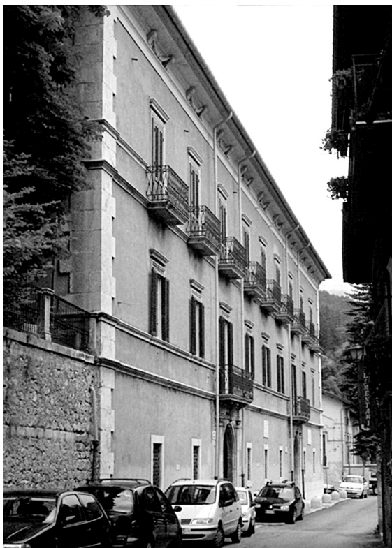
Palazzo Sipari, esterno.

Oltre alle sale, che hanno ospitato diversi esponenti di casa Savoia, è possibile ammirare il giardino pensile nonché tutta la parte del Palazzo occupata dalle stanze di servizio. Di prossima apertura al pubblico, invece, l'importante biblioteca nella