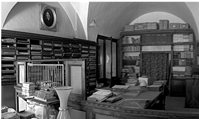
Palazzo Sipari, interno.

Una Fondazione, quindi, con progetti ambiziosi e che ci fa piacere segnalare anche per riscoprire l'azione di un uomo politico che su diverse questioni dimostra ancora una sua attualità a quasi un secolo dalla sua entrata in Parlamento.