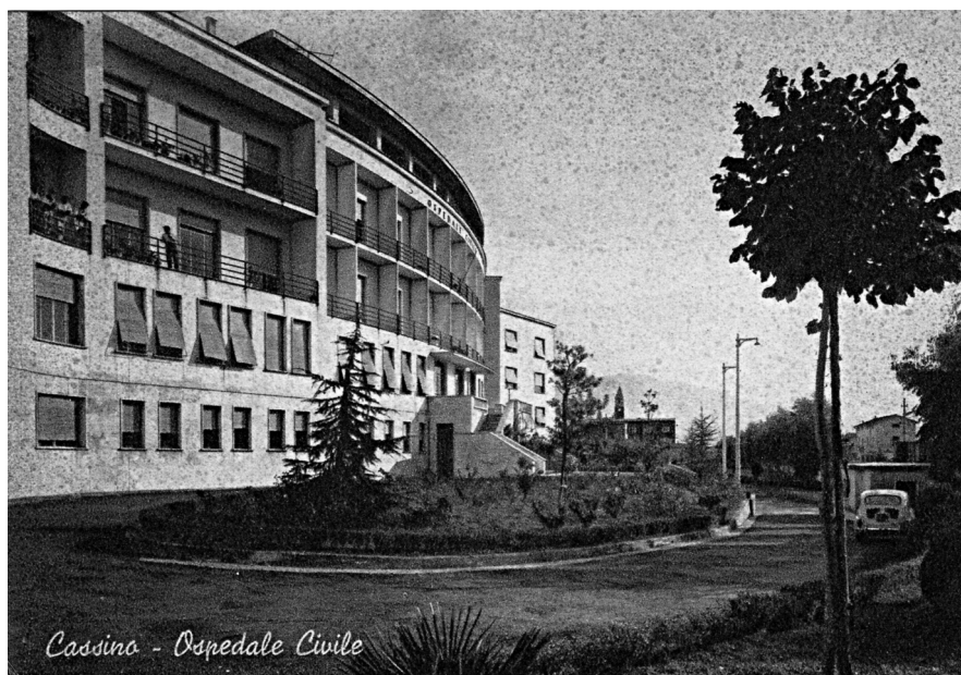
L'ospedale negli anni '50

ospedale. L'esigenza di più adeguate risposte ospedaliere ad una diffusa e crescente domanda di salute determinò un sollecito e consistente ampliamento del nuovo edificio: due corpi di fabbrica laterali ne triplicarono l'originaria dimensione