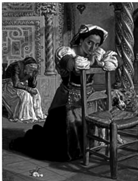
Una donna in costume napoletano di Holman Hunt.

i pre-Raffaelliti; solo nel 1867 riprese il quadro e lo completò con lo sfondo della chiesa.