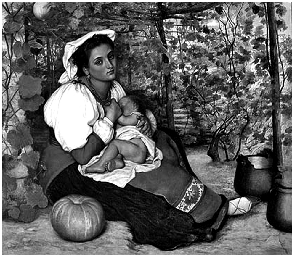
"Una donna di San Germano" di Robert Braithwaite Martineau.