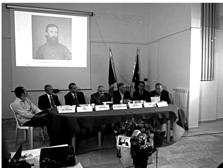
I relatori e il pubblico in sala.