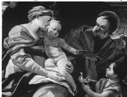
La Sacra Famiglia. Particolare