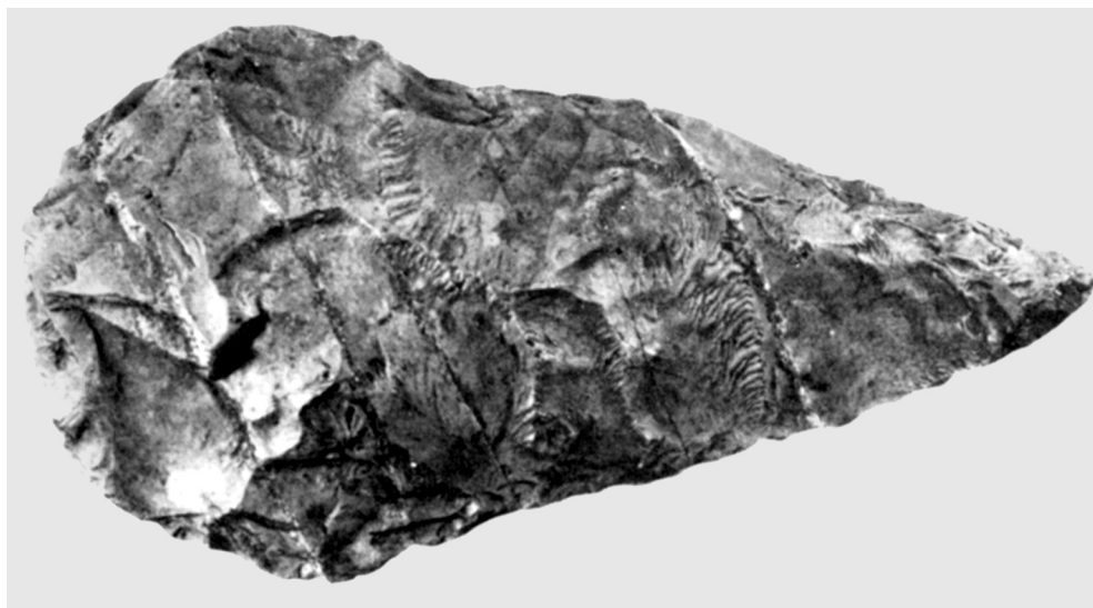
l'amigdala di Aquino.

pezzo, lo pulisce alla meglio e poi fa combaciare le due parti, laddove la lama del piccone aveva colpito: l'ipotesi di Rocco, ovvero quella sensazione che l'aveva sfiorato, è confermata.