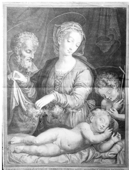
Stampa de La Sacra Famiglia con in basso la scritta «Ex celeberrima Raphaelis Urbinae tabula apud Montem Cassinum extante».

Il dipinto rimase a Montecassino fino al 1799 quando le truppe francesi, guidate dal generale Jean Étienne Championnet 2 , occuparono il monastero e lo depredarono di opere d'arte, di ogni oreficeria della basilica e di preziosi documenti di archivio. Tra i tanti beni saccheggiati, il generale Championnet portò via il dipinto de La Sacra Famiglia . Durante gli anni i tentativi da parte dell'Abbazia di recuperare il quadro furono vani e ad oggi si sono perse le tracce del prezioso dipinto.