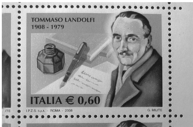
Francobollo emesso in occasione del centenario della nascita di Tommaso Landolfi.