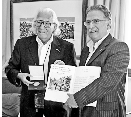
Cassino 2009: Tony Vaccaro riceve dal sindaco Bruno Scittarelli la medaglia commemorativa.

La città di New York aveva celebrato l'evento con una mostra intitolata « Tony Vaccaro: the Centennial Exhibition ». Era noto in tutto il modo per aver raccontato con i suoi scatti la seconda guerra mondiale (soprattutto lo sbarco in Normandia, la battaglia delle Ardenne e la conquista di Berlino di cui fu protagonista in prima persona). Nella veste di fotografo-soldato Vaccaro documenta e partecipa all'avanzata alleata attraverso