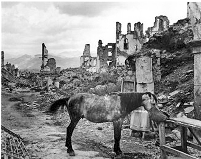
Cassino 1946.