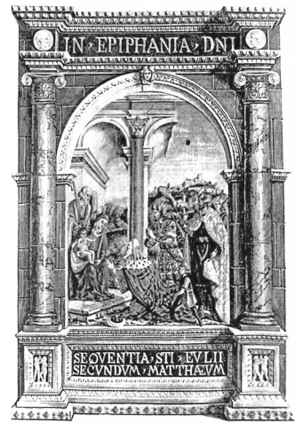
Adorazione dei Magi - dall'Evangelario di d. Eusebio.

Il nostro pianto si mesce con quello della famiglia, ma la nostra anima sarà sempre con lui, per ricordarne l'esempio che non si cancella.