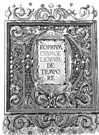
Evangelario miniato da d. Eusebio Grossetti.