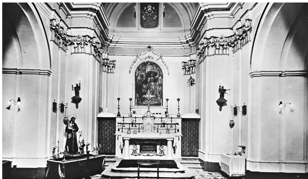
Interno della chiesa di San Pietro prima della Seconda guerra mondiale.

chivio di Montecassino. In tutte le altre descrizioni della città la chiesa viene nominata come una delle quattro parrocchie presenti a Cassino almeno fino alla distruzione della città durante il secondo conflitto mondiale.