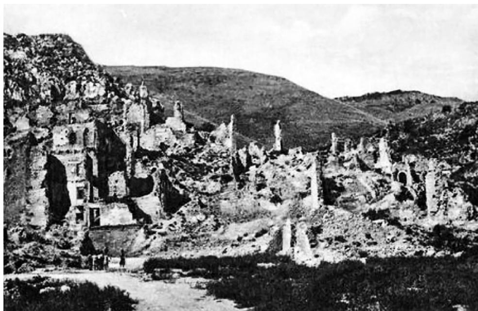
Le rovine della chiesa di San Pietro viste dall'attuale piazza Santa Scolastica.

Probabilmente fu costruita con il ricavato della vendita delle rovine della precedente e diruta chiesa di San Pietro, la quale sembra esser nata prima come tempio costruito da Ummidia Quadratilla nel centro della Casinum romana, poi trasformato nel VIII secolo in chiesa da Scauniperga, moglie di Gisulfo II duca di Benevento. Infatti, in una richiesta del 10 gennaio 1621 fatta all'Abate, si chiede di poter vendere il materiale dell'abbattimento dell'edificio, divenuto ormai rifugio di bestie dopo la caduta della facciata, e con il ricavato edificare una cappella nella vicina San Germano. Questo documento di autorizzazione porta la firma dell'Abate Onorato. Così nella collegiata di San Germano vennero posizionate due statue in legno di noce ai lati del coro e venne costruita la cappella di San Pietro, elevata poi al rango di parrocchia come si può vedere ne «Lo stato delle anime della parrocchia di San Pietro in castro» del 1693, registro conservato presso l'Ar-