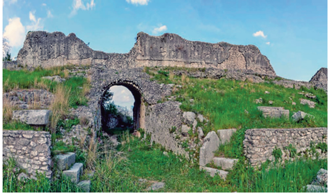
Cassino: Parco archeologico.

di agonia, grido di rabbia disperate: questo è lo spettacolo grandioso per il popolo romano che urla e s'inebria come un mostro dai mille volti. Ma la grande festa nella mia rievocazione era finita. Passò un fanciullo zufolando: come mi vide si soffermò a guardare anch'egli con i suoi larghi occhi curiosi. L'urlo di una sirena si prolungò nella lontananza, lacerò lo spazio,