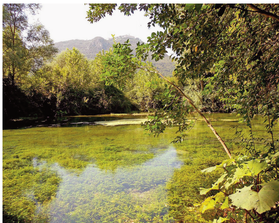
Cassino: Terme varroniane.

Cicerone celebrò la villa di Varrone e imprecò contro lo scempio che di essa fecero le soldataglie di Marco Aurelio Antonio.