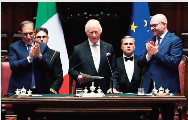
L'intervento di re Carlo III al Parlamento italiano.

alle 14.50 nel Parlamento riunito in seduta comune, dopo l'introduzione dei presidenti di Camera e Senato, Lorenzo Fontana e Ignazio La Russa, è intervenuto re Carlo. Parafrasando un celebre film sulla figura del nonno, re Giorgio VI, si potrebbe definire Il discorso del re . Parte dell'intervento è stato tenuto in italiano: «Spero di