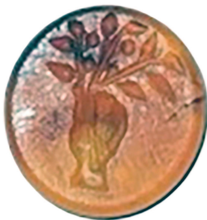
Fig. 3. Corniola rinvenuta tra le zolle, in area urbana.