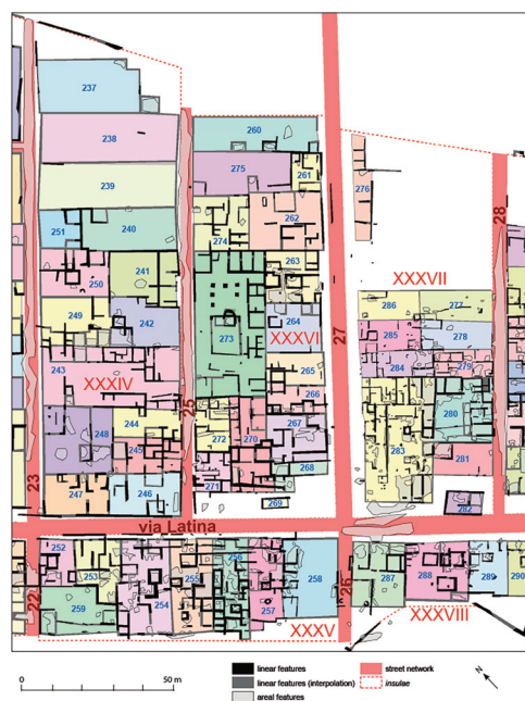
Fig. 2. Particolare. Interpretazione (parz.) delle insule XXXIV, XXXV, XXXVI, XXXVII e XXXVIII (Launaro-Millett 2023, p. 65, fig. 4.17).

Nel centro abitato di Interamna Lirenas 1 (Fig. 1), all'incrocio del cardo primo, via per Casinum , e il primo decumano, via Latina Vetus , in un terreno volto a maggesi 2 (Fig. 2) si è rinvenuta una corniola 3 .