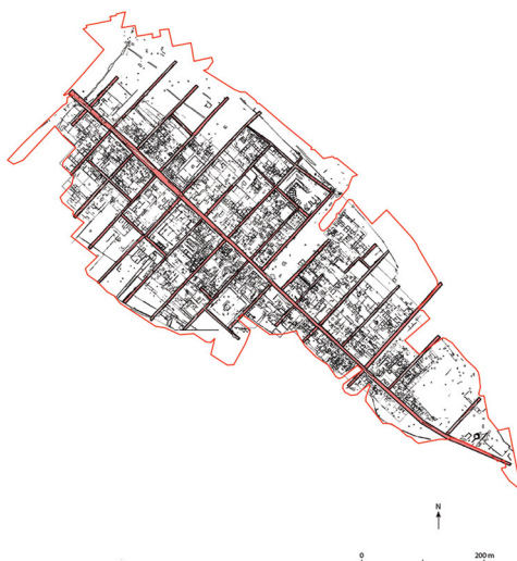
Fig. 1. Area urbana d' Interamna Lirenas . Interpretazione generale delle anomalie magnetiche e GPR nel sito (Launaro-Millett 2023, p. 44, fig. 4.5).